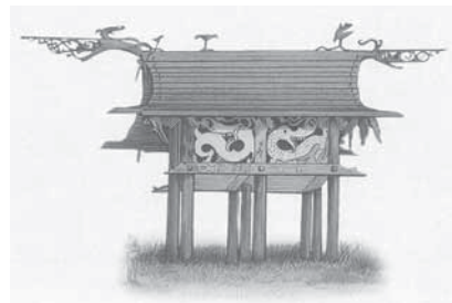
Rumah Arwah di Kalimantan (Foto-foto di hlm 40+41 Dari „Indonesian Heritage: Religion and Ritual“)