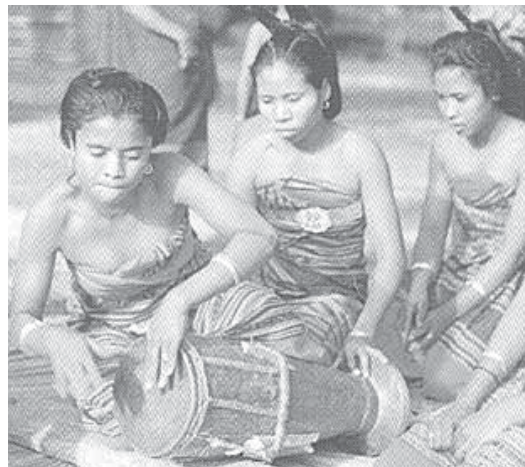
.Upacara Adat di Timor

menyebutnya Puang Matua ; Pue Mpalaburu dalam suku Pamona, Uis Neno dalam Suku Atoni Meto di Timor 4 , Dibata dalam suku Batak Karo, Sangia dalam suku Tolaki, dan lain-lain. Yang Ilahi itu memberikan perlindungan kepada manusia dalam hidupnya. Karena itu, manusia menyapanya baik pada saat berada dalam keadaan bersukacita maupun pada saat berdukacita. Manusia menyapa Yang Ilahi dengan maksud memohon ( Footnotes ) perlindungan dari berbagai ancaman. Itulah sikap mereka yang menggambarkan pemahaman tentang rasa ketuhanan.