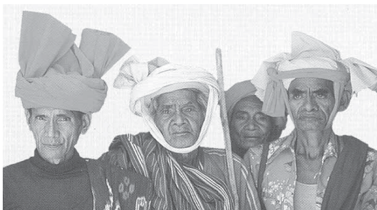
Iman-iman Marapu di Sumba

Dalam kepercayaan agama suku ibadah atau ritus yang dilakukan berkembang sejalan dengan