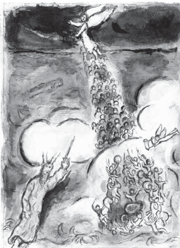
Musa memimpin bangsa Israel keluar dari Mesir. Gambar oleh Marc Chagall.

Kel 15:2-18 yang dikutip lengkap. Sebetulnya siapa yang bernyanyi dangdut? Dalam keberadaannya yang seperti sekarang ini, teksnya memuat dua nyanyian kemenangan, yang satu dari Musa dan panjang sekali, yang lain dari Miryam dan pendek sekali. Saya malah curiga bahwa sebenarnya yang menyanyikan nyanyian kemenangan itu adalah Miryam dan perempuan-perempuan, tetapi kemudian oleh redaktur yang pro Musa dan anti perempuan, nyanyian kemenangan itu lalu ditaruh di mulut Musa dan laki-laki yang lain. Tetapi teks juga tetap memuat nyanyian Miryam, meskipun hanya 2 baris. Dari keanehan nyanyian di atas saya melanjutkan kecurigaan dan menduga bahwa istilah-istilah yang diberikan kepada Miryam di atas juga dilakukan dalam rangka menurunkan kepemimpinan Miryam dan sebaliknya menaikkan kepemimpinan Musa. Kalau saya mengemukakan bahwa redaktornya yang berbuat demikian, maka mungkin sekali Musanya sendiri tidak demikian. Tetapi kita tidak memiliki versi asli dari kisah Keluaran, maka kita terpaksa mengandalkan pada teks sebagaimana adanya sekarang ini, yang memberikan kesan bahwa Musa sejak di pinggir laut Merah sudah mempunyai kecenderungan untuk meminimalisasikan peranan Miryam saudaranya.